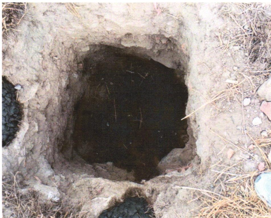
FOTO 03 -ESCAVAÇÃO MANUAL PARA BLOCO DE COROAMENTO OU SAPATA (INCLUINDO ESCAVAÇÃO PARA COLOCAÇÃO DE FÔRMAS). AF_06/2017