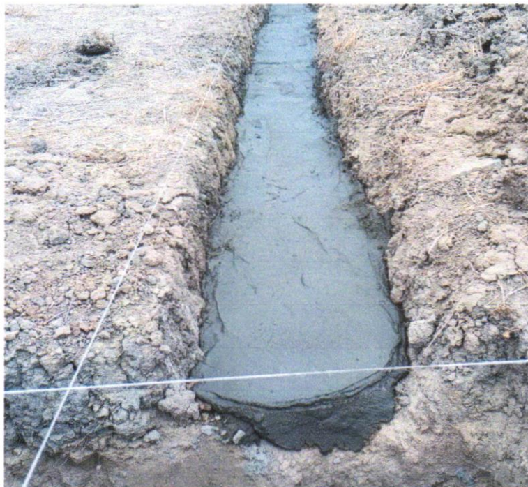
FOTO 07 – LASTRO DE CONCRETO MAGRO, APLICADO EM BLOCOS DE COROAMENTO OUSAPATAS, ESPESSURA DE 3 CM. AF_08/2017