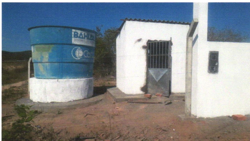
Foto 14- APLICAÇÃO MANUAL DE PINTURA COM TINTA LÁTEX ACRÍLICA EM PAREDES, DUAS DEMÃOS.