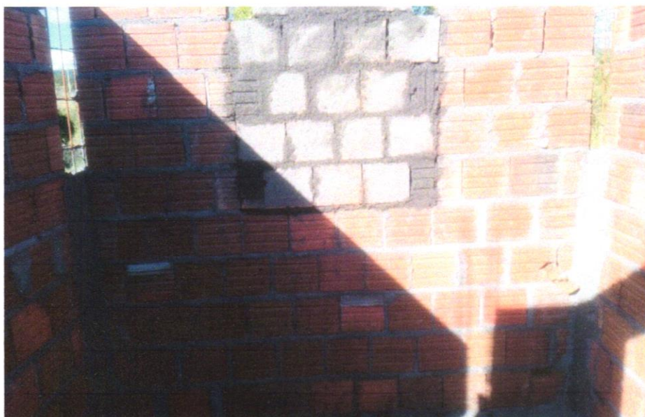
FOTO 17 –ALVENARIA DE VEDAÇÃO DE BLOCOS CERÂMICOS FURADOS NA HORIZONTAL DE 9X19X19CM (ESPESSURA 9CM) DE PAREDES COM ÁREA LÍQUIDA MENOR QUE 6M² SEM VÃOS E ARGAMASSA DE ASSENTAMENTO COM PREPARO EM BETONEIRA. AF_06/201