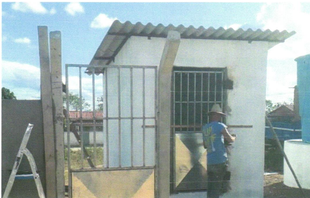
Foto 13 - TELHAMENTO COM TELHA DE FIBROCIMENTO