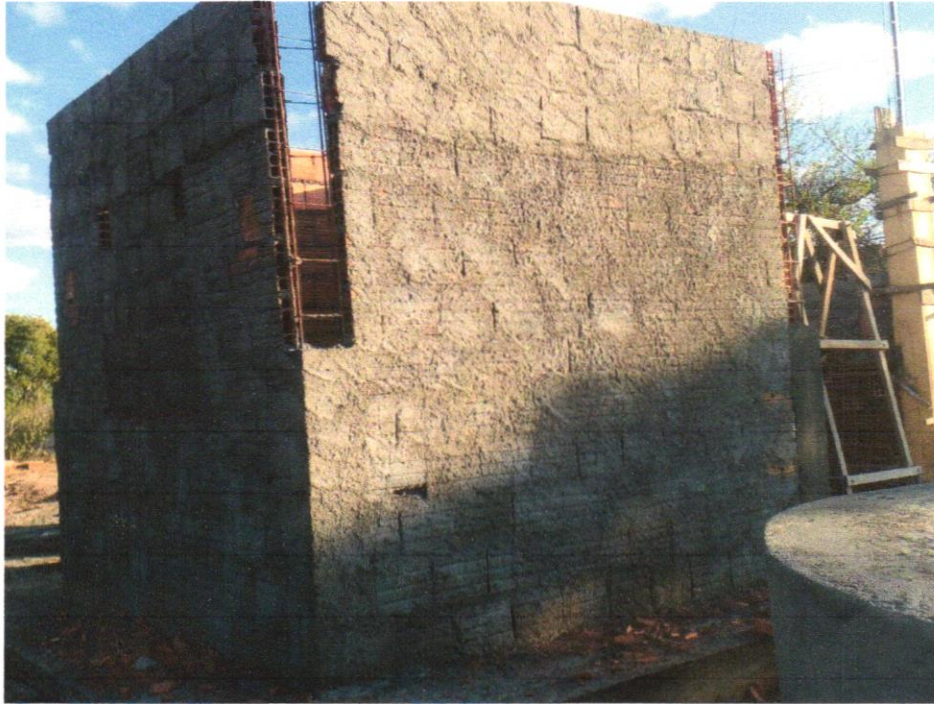
Foto 11 - CHAPISCO APLICADO EM ALVENARIAS E ESTRUTURAS DE CONCRETO INTERNAS, COM COLHER DE PEDREIRO. ARGAMASSA TRAÇO 1:3 COM PREPARO EM BETONEIRA 400L. AF_06/2014