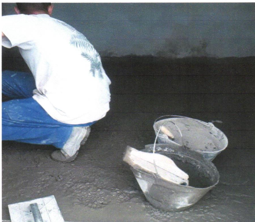
Foto 15 ARGAMASSA TRAÇO 1:3 (EM VOLUME DECIMENTO E AREIA MÉDIA ÚMIDA) PARA CONTRAPISO, PREPARO MECÂNICO COM BETONEIRA 600 L. AF_08/2019