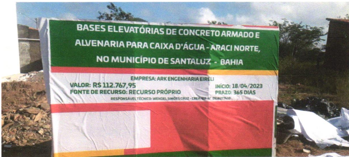
FOTO 01 – Placa de obra em chapa aço galvanizado, instalada - Rev 02_01/2022