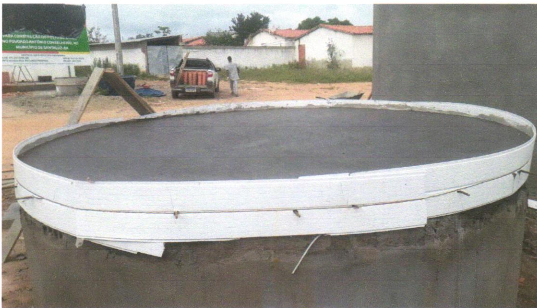
FOTO 09 – CONCRETO FCK = 20MPA, TRAÇO 1:2,7:3 (EM MASSASECA DE CIMENTO/ AREIA MÉDIA/ BRITA - PREPARO MECÂNICO COM BETONEIRA 600 L.AF_05/2021