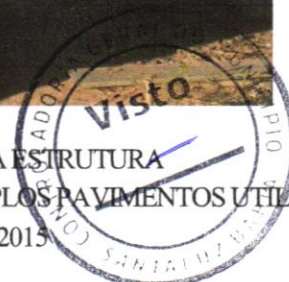
FOTO 08 – ARMAÇÃO DE PILAR OU VIGA DE UMA ESTRUTURA CONVENCIONAL DE CONCRETO ARMADO EM UM EDIFÍCIO DE MÚLTIPLOS PAVIMENTOS UTILIZANDO AÇO CA-50 DE 8,0 MM -MONTAGEM. AF_12/2015

Evaldo Almeida Moraes Engenheiro Civil RNP 051417303-3