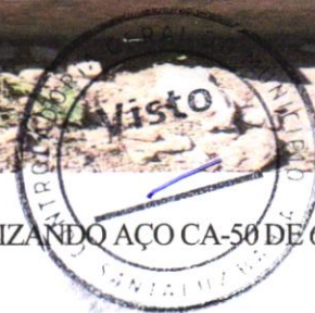
FOTO 04 – ARMAÇÃO DE BLOCO, VIGA BALDRAME OUS APATA UTILIZANDO AÇO CA-50 DE 6,3 MM- MONTAGEM. AF_06/2017

Evaldo Almeida Moraes Engenheiro Civil RNP 09141V303-3