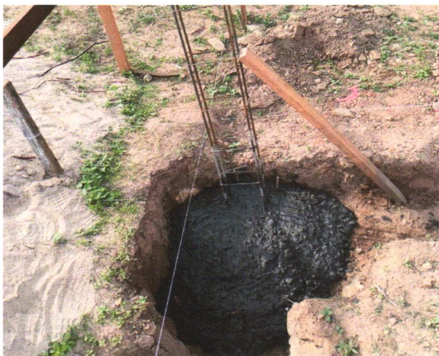
FOTO 05 – CONCRETO FCK = 20MPA, TRAÇO 1:2,7:3 (EM MASSASECA DE CIMENTO/ AREIA MÉDIA/ BRITA 1)- PREPARO MECÂNICO COM BETONEIRA 400 L. AF_05/202