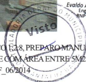
Foto 12 - EMBOÇO, PARA RECEBIMENTO DE CERÂMICA, EM ARGAMASSA TRAÇO 1:2:8, PREPARO MANUAL, APLICADO MANUALMENTE EM FACES INTERNAS DE PAREDES, PARA AMBIENTE COM ÁREA ENTRE 5M2 E 10M2, ESPESSURA DE 20MM, COM EXECUÇÃO DE TALISCAS. AF_06/2014

Evaldo Amador Moraes Engenheiro Civil RNP 051419303-3