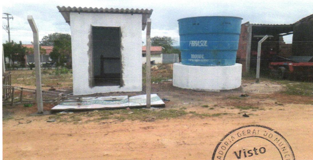
Foto 16 - APLICAÇÃO MANUAL DE PINTURA COM TINTA LÁTEX ACRÍLICA EM PAREDES, DUAS DEMÃOS. AF_06/2014 acerca Araforros ou similar, instalado - Rev 06

Wendel Simões Cruz CREA 13.749.775/0001 RUA SAGUARAIA, 132 - GUA- RAN - JARDIM SÃO CARLOS - RECIFE - PE CEP: 51.240-000